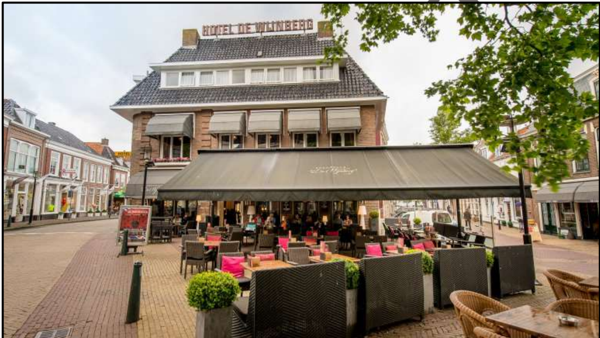
Koffiestop in Bolsward.

een heerlijke kop koffie op het gezellige marktplein. De motor parkeerde ik vlak voor het terras en ik werd daarbij nauwlettend in de gaten gehouden door een oude baas die, zo vermoedde ik, zijn rustige ochtendkoffie verloren zag gaan door gegrom en geronk uit de uitlaten van de Triple. Niets was minder waar, want ik had de contactsleutel nog niet teruggedraaid of ik kreeg een compliment van de Fries; wat een prachtige motor en eindelijk eens niet zo'n nieuwerwets ding. Inderdaad, de Speed Triple komt uit 1996 en heeft, in echte Engelse stijl, controlelampjes die het vaker niet dan wel doen. Het label 'moderne klassieker' is wel op zijn plaats, zo waren de bewonderaar en ik het snel eens.