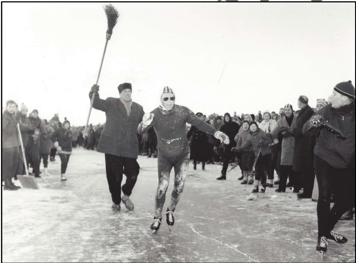
Elfstedentochtwinnaar Reinier Paping in 1963.

In 1909 werd de eerste officiële Elfstedentocht geschaatst. De tocht, waarbij op een enkele dag de elf steden van Friesland worden aangedaan, spreekt voor velen tot de verbeelding; het helse jaar 1963, met 18 graden vorst bij de start, en winnaars als Abe de Vries, Reinier Paping, Evert van Benthem en Henk Angenent zitten in ons collectief geheugen. Menig schaatser droomt er dan ook van de tocht een keer te schaatsen. Of dat er ooit nog van komt is al sinds de laatste editie in 1997 onderwerp van discussie, maar wij motorrijders hoeven natuurlijk helemaal niet op strenge vorst te wachten.