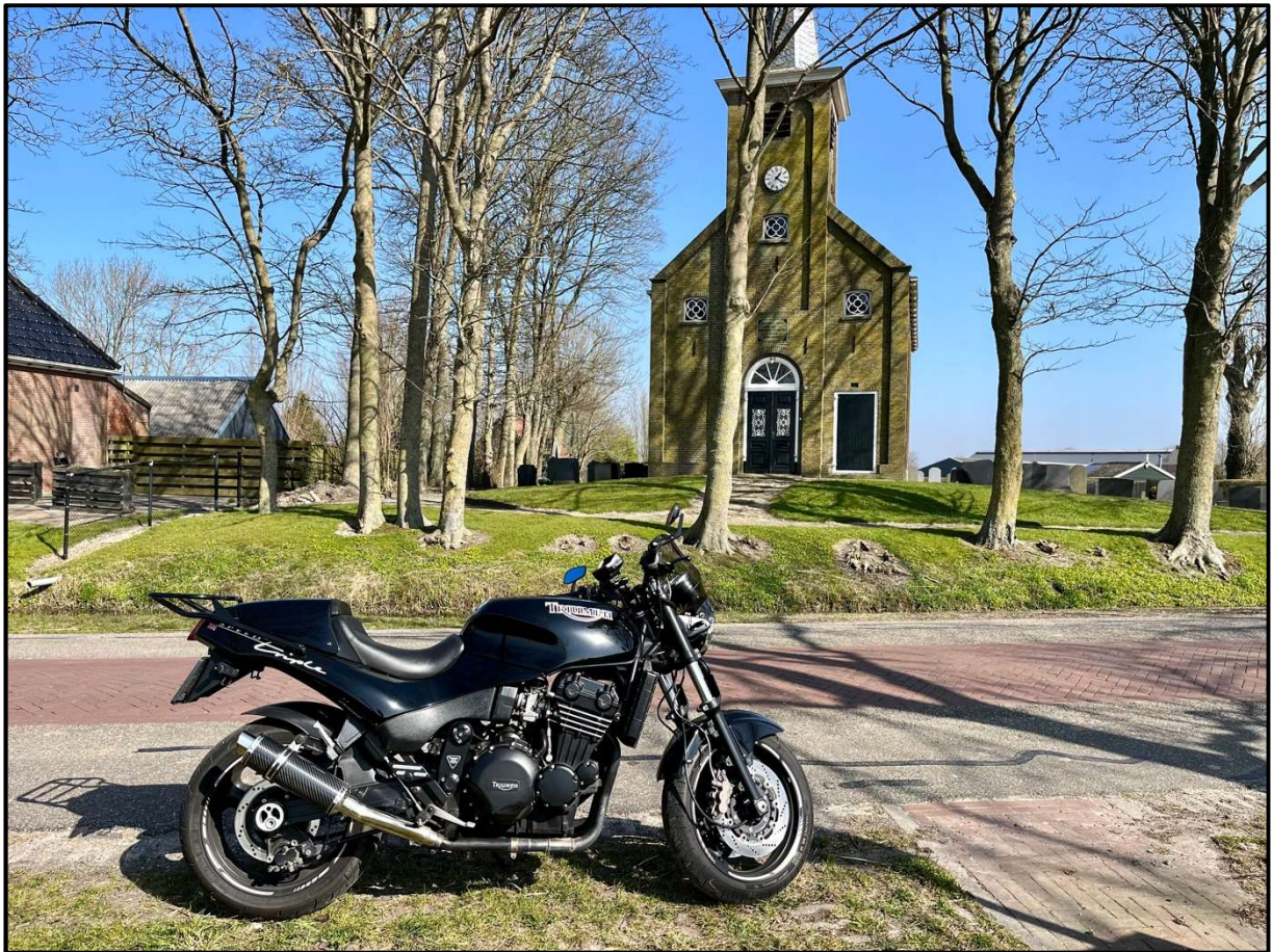
Lunchstop 'op' De Hiaure.

en een toename van verkeerslichten. In vergelijking met de randstad is het echter nog steeds heerlijk rustig toeven.