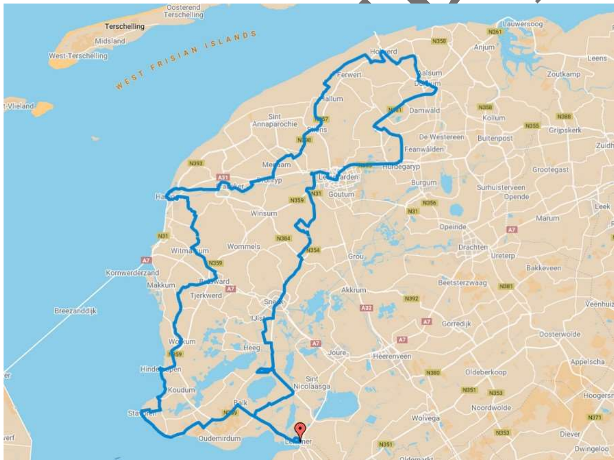
De vanuit Lemmer gereden Motorelfstedentocht.